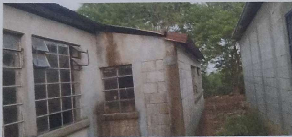
Foto 3: Se observa las laminas deterioradas y presencia de humedad en la pared del modulo 1.