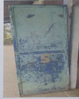
Foto 2: Se observa el deterioro y el desprendimiento de las puertas del modulo 1.