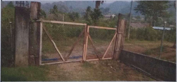
Foto 6: Se observa el porton del ingreso principal en mal estado.

Observación: Si es necesario se pueden agregar hojas adicionales. Indicar el número de hojas.