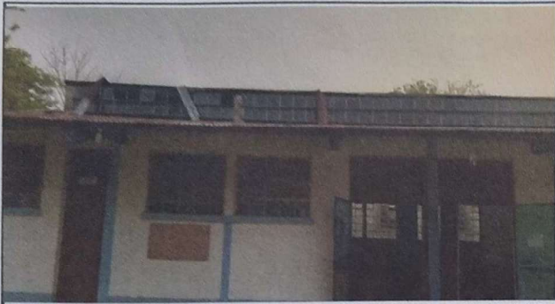
Foto 1: Se observa que las laminas y los capotes estan deterioradas y desprendiendo del modulo 1.